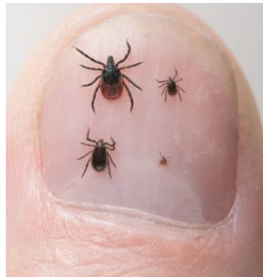
Een duimnagel met daarop vier teken.